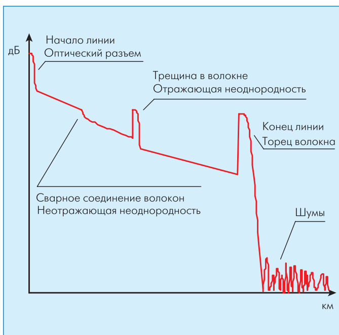
Рис. 2 Типичная рефлектограмма

Во время монтажа PON необходимо быть уверенным, что каждая секция выполняет требования спецификации. Это возможно проверить с помощью оптического рефлектометра (OTDR). В отличие от измерителя оптических потерь, который измеряет общее затухание всей линии, рефлектометр позволяет измерить распределение потерь вдоль ли-