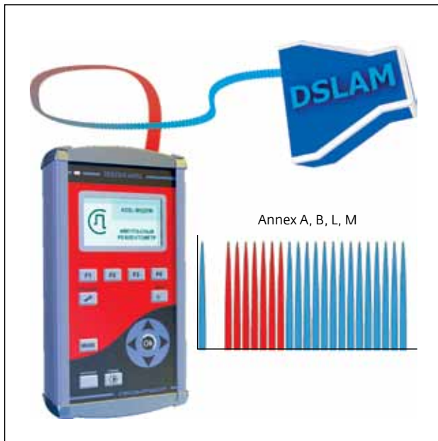
Рис.1. Модемное тестирование линии с помощью TESTER ADSL компании "Связьприбор"

Для оценки качества линии излюбленным параметром измерителей является интегральная величина отношения сигнал/шум SNR в нисходящем потоке (к абоненту). В практике измерителей оценка "плохо" выставляется при SNR 6 дБ, а хорошая - при SNR выше 10 дБ. Впрочем, необходимо помнить, что эти показания зависят от настроек DSLAM. Если на линии проблемы, измерителю требуются параметры каждого бина (рис.3), чтобы увидеть, на каких частотах наблюдается "провал" характеристик, и попытаться установить причину неисправности.