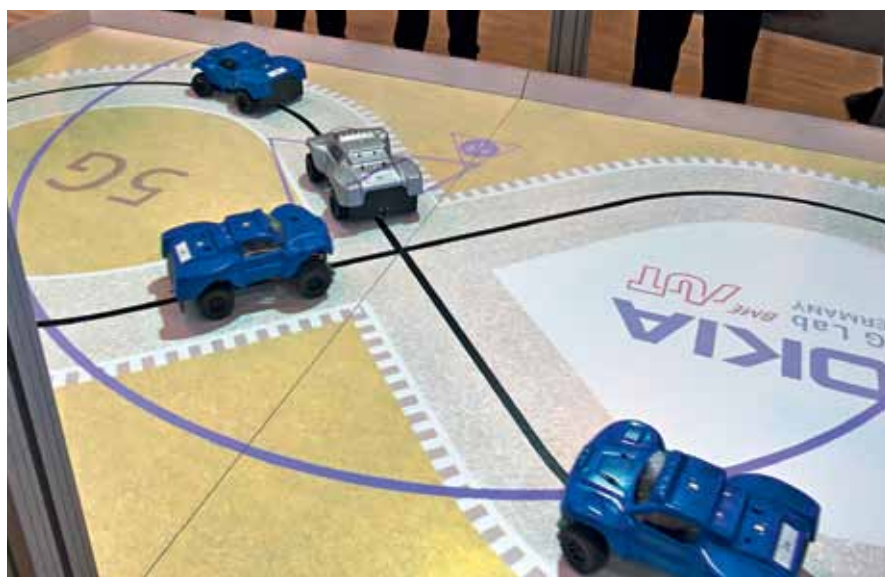
Управление транспортными средствами через беспроводную сеть со сверхнизкими задержками

Со своей стороны, мы в Nokia Bell Labs активно способствуем скорейшему приходу эры 5G. Например, на выставке MWC 2016 мы демонстрируем прототип базовой станции 5G, которая поддерживает одновременно 1,2 млн. соединений. Напомню, типичная