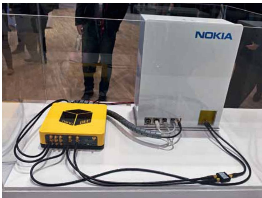
Прототип базовой станции, поддерживающий 1,2 млн. соединений

Так что с наступлением 5G прежние технологии не уйдут. И наша работа – научить их работать совместно. Ведь конечному пользователю важно получить информацию, и ему дела нет до того, как она к нему попадает – через сеть Wi-Fi или 5G. Мой телефон 10 лет назад имел всего один радиointерфейс, и я мог одновременно говорить только с одним собеседником. Сегодня мой телефон содержит шесть радиотрактов, и я одновременно могу